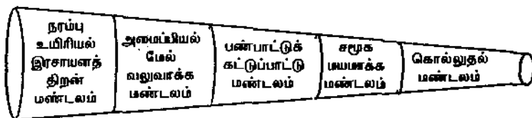
படம் - 1

கொலை முதல் வெகுஜன பேரழிவு வரையான இரத்தம் சிந்துதல் நிகழுமிடம் கொல்லுதல் மண்டலமாகும் (Killing Zone) நேரடியாகப் பயிற்சியினாலோ அல்லது பார்த்த மாதிரிகளைப் பின்பற்றுவதினாலோ மக்கள் கொல்லக் கற்றுக் கொள்ளும் சமூகமயமாக்க மண்டலம் (Socialization Zone) அடுத்துள்ளது. கொல்லுதலைத் தவிர்க்க முடியாததாகவும் சட்டப்பூர்வமானதாகும் என்றுக் கொள்ளும் வகையில் முன்பே தயாரிக்கப்பட்டு விட்ட நிலை பண்பாட்டு கட்டுப்பாட்டு மண்டலமாகும் (Cultural conditioning Zone) சமயம், அரசியல் சித்தாந்தங்கள், வெற்றிகளையும் அட்டுழியங்களையும் கொண்டாடல், குடும்ப மரபு, சட்டம், வெகுஜனத் தகவல் தொடர்பு, கலைகள் முதலியன இக்கட்டுப்பாட்டுக்கான வளங்களாகும். சமூக-பொருளாதார உறவுகள், நிறுவனங்கள், பொருள் வளங்கள் முதலியன கொல்வதை முன்சுட்டியே முடிவு செய்வதாகவும் ஆதரிப்பதாகவும் உள்ளன. இது அமைச்சியல் மேல் வலுவாக்க மண்டலமாகும் (Structural reinforcement Zone) நரம்பு உயிரியல் இரசாயன திறன் மண்டலம் (neuro-biochemical capability zone) உள்ளடக்கிய உடலியல், நரம்பியல், மூளை ஆகியவற்றின் செயல்பாடுகளும்