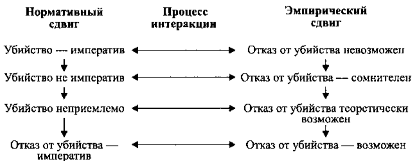
Рис. 3. Процесс сдвига к нормативно-эмпирической парадигме отказа от убийства.